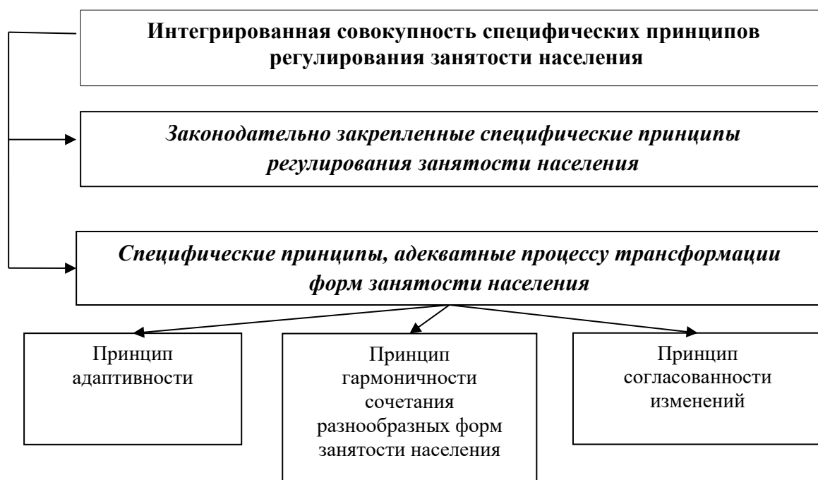
Рисунок 2. Интегрированная совокупность специфических принципов регулирования занятости населения

Принцип гармоничности сочетания разнообразных форм занятости предполагает баланс между стандартной и нестандартной занятостью населения, соответствующий структуре экономики и потребностям как отдельного человека, так и общества в целом.