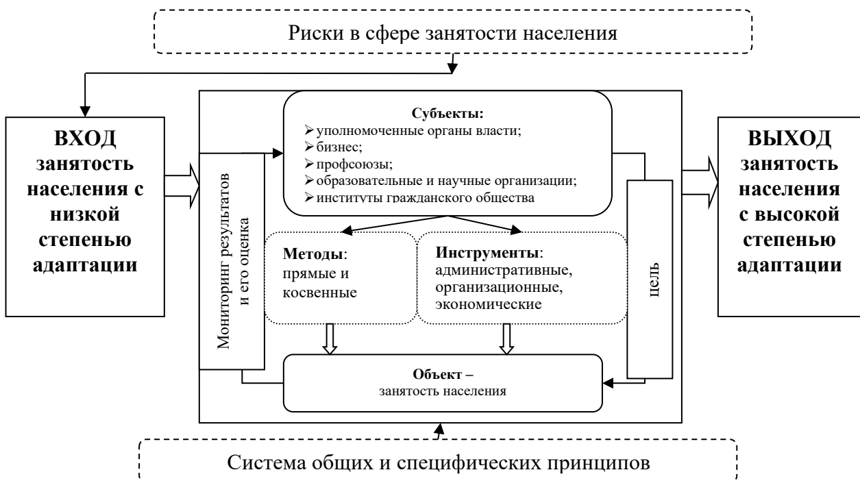
Рисунок 4. Модель функционирования механизма повышения степени адаптации занятости населения к изменяющимся социально-экономическим условиям

Модель функционирования механизма повышения степени адаптации занятости населения к изменяющимся социально-экономическим условиям представлена на рис. 4.